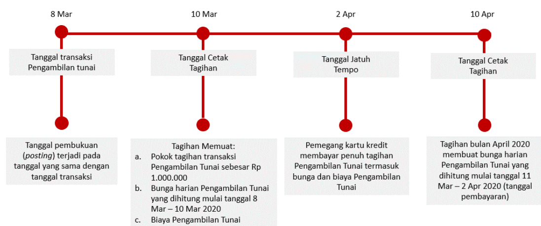
Ilustrasi Perhitungan Bunga Transaksi Tarik Tunai (Cash Advance)

Bunga untuk Pengambilan Tunai (Cash Advance) dibebankan dan dihitung sejak Tanggal Penarikan (Cash Advance) sampai dengan tanggal dilakukannya pembayaran penuh dari transaksi Pengambilan Tunai tersebut. Suku bunga yang berlaku untuk transaksi Pengambilan Tunai tercantum pada Lembar Penagihan. Biaya, denda, ataupun bunga yang belum dibayarkan tidak termasuk dalam komponen perhitungan bunga. Untuk perhitungan bunga secara lengkap dapat dilihat pada ilustrasi Perhitungan Bunga Kartu Kredit.