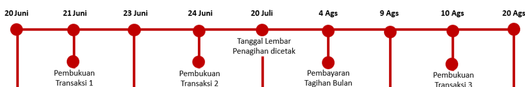
Ilustrasi Perhitungan Bunga Transaksi Pembelanjaan (Ritel)

Perhitungan Bunga Untuk Transaksi Pembelanjaan (Ritel): Bunga akan dikenakan jika Pemegang Kartu membayar kurang dari total tagihan baru, atau membayar setelah Tanggal Jatuh Tempo. Bunga untuk Transaksi Pembelanjaan dihitung berdasarkan Tanggal Pembukuan (Posting Date) dari transaksi yang dilakukan. Suku bunga yang berlaku untuk transaksi pembelanjaan tercantum pada Lembar Penagihan. Biaya, denda, ataupun bunga yang belum dibayarkan tidak termasuk dalam komponen perhitungan bunga. Bunga akan ditagihkan pada lembar penagihan berikutnya. Untuk perhitungan bunga secara lengkap dapat dilihat pada ilustrasi perhitungan bunga Kartu Kredit.