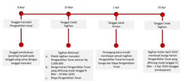
Ilustrasi Perhitungan Bunga Transaksi Tarik Tunai (Cash Advance)

Bunga untuk Pengambilan Tunai (Cash Advance) dibebankan dan dihitung sejak Tanggal Penarikan (Cash Advance) sampai dengan tanggal dilakukannya pembayaran penuh dari transaksi Pengambilan Tunai tersebut. Suku bunga yang berlaku untuk transaksi Pengambilan Tunai tercantum pada Lembar Penagihan. Biaya, denda, ataupun bunga yang belum dibayarkan tidak termasuk dalam komponen perhitungan bunga. Untuk perhitungan bunga secara lengkap dapat dilihat pada ilustrasi Perhitungan Bunga Kartu Kredit.