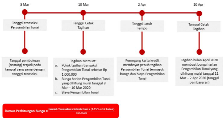
Ilustrasi Perhitungan Bunga Transaksi Tarik Tunai (Cash Advance)

Bunga untuk Pengambilan Tunai (Cash Advance) dibebankan dan dihitung sejak Tanggal Penarikan (Cash Advance) sampai dengan tanggal dilakukannya pembayaran penuh dari transaksi Pengambilan Tunai tersebut. Suku bunga yang berlaku untuk transaksi Pengambilan Tunai tercantum pada Lembar Penagihan. Biaya, denda, ataupun bunga yang belum dibayarkan tidak termasuk dalam komponen perhitungan bunga. Untuk perhitungan bunga secara lengkap dapat dilihat pada ilustrasi Perhitungan Bunga Kartu Kredit.