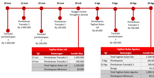
Ilustrasi Perhitungan Bunga Transaksi Pembelanjaan (Ritel)

Bunga akan dikenakan jika Pemegang Kartu membayar kurang dari total tagihan baru, atau membayar setelah Tanggal Jatuh Tempo. Bunga untuk Transaksi Pembelanjaan dihitung berdasarkan Tanggal Pembukuan (Posting Date) dari transaksi yang dilakukan. Suku bunga yang berlaku untuk transaksi pembelanjaan tercantum pada Lembar Penagihan. Biaya, denda, ataupun bunga yang belum dibayarkan tidak termasuk dalam komponen perhitungan bunga. Bunga akan ditagihkan pada lembar penagihan berikutnya. Untuk perhitungan bunga secara lengkap dapat dilihat pada ilustrasi perhitungan bunga Kartu Kredit.