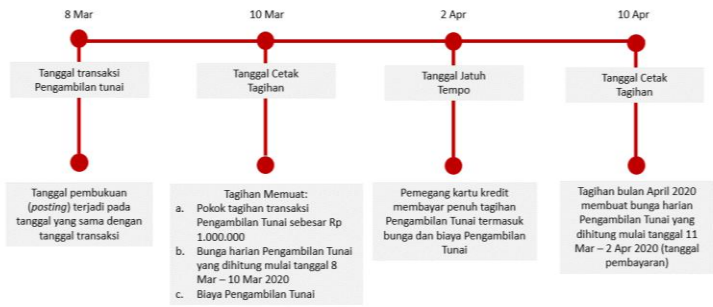
Ilustrasi Perhitungan Bunga Transaksi Tarik Tunai (Cash Advance)

Bunga untuk Pengambilan Tunai (Cash Advance) dibebankan dan dihitung sejak Tanggal Penarikan (Cash Advance) sampai dengan tanggal dilakukannya pembayaran penuh dari transaksi Pengambilan Tunai tersebut. Suku bunga yang berlaku untuk transaksi Pengambilan Tunai tercantum pada Lembar Penagihan. Biaya, denda, ataupun bunga yang belum dibayarkan tidak termasuk dalam komponen perhitungan bunga. Untuk perhitungan bunga secara lengkap dapat dilihat pada ilustrasi Perhitungan Bunga Kartu Kredit.