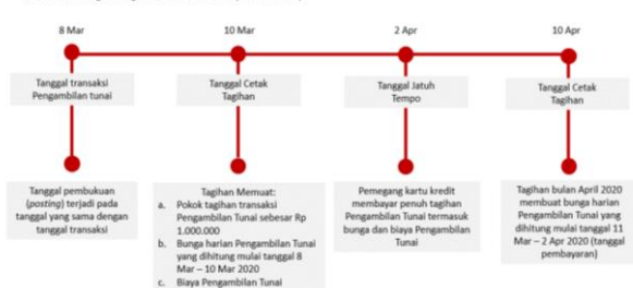
Ilustrasi Perhitungan Bunga Transaksi Tarik Tunai (Cash Advance)

Bunga untuk Pengambilan Tunai (Cash Advance) dibebankan dan dihitung sejak Tanggal Penarikan (Cash Advance) sampai dengan tanggal dilakukannya pembayaran penuh dari transaksi Pengambilan Tunai tersebut. Suku bunga yang berlaku untuk transaksi Pengambilan Tunai tercantum pada Lembar Penagihan. Biaya, denda, ataupun bunga yang belum dibayarkan tidak termasuk dalam komponen perhitungan bunga. Untuk perhitungan bunga secara lengkap dapat dilihat pada ilustrasi Perhitungan Bunga Kartu Kredit.