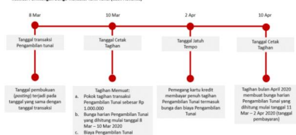
Ilustrasi Perhitungan Bunga Transaksi Tarik Tunai (Cash Advance)

Bunga untuk Pengambilan Tunai (Cash Advance) dibebankan dan dihitung sejak Tanggal Penarikan (Cash Advance) sampai dengan tanggal dilakukannya pembayaran penuh dari transaksi Pengambilan Tunai tersebut. Suku bunga yang berlaku untuk transaksi Pengambilan Tunai tercantum pada Lembar Penagihan. Biaya, denda, ataupun bunga yang belum dibayarkan tidak termasuk dalam komponen perhitungan bunga. Untuk perhitungan bunga secara lengkap dapat dilihat pada ilustrasi Perhitungan Bunga Kartu Kredit.