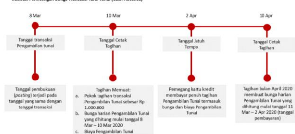
Ilustrasi Perhitungan Bunga Transaksi Tarik Tunai (Cash Advance)

Bunga untuk Pengambilan Tunai (Cash Advance) dibebankan dan dihitung sejak Tanggal Penarikan (Cash Advance) sampai dengan tanggal dilakukannya pembayaran penuh dari transaksi Pengambilan Tunai tersebut. Suku bunga yang berlaku untuk transaksi Pengambilan Tunai tercantum pada Lembar Penagihan. Biaya, denda, ataupun bunga yang belum dibayarkan tidak termasuk dalam komponen perhitungan bunga. Untuk perhitungan bunga secara lengkap dapat dilihat pada ilustrasi Perhitungan Bunga Kartu Kredit.