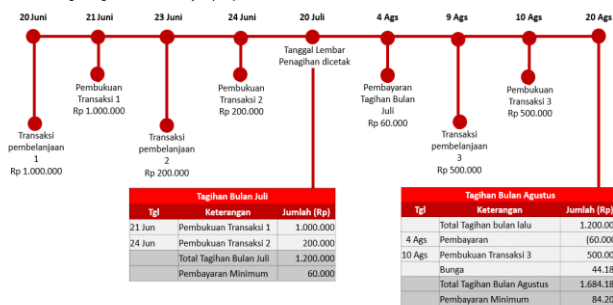
Ilustrasi Perhitungan Bunga Transaksi Pembelian (Ritel)

Bunga akan dikenakan jika Pemegang Kartu membayar kurang dari total tagihan baru, atau membayar setelah Tanggal Jatuh Tempo. Bunga untuk Transaksi Pembelian dihitung berdasarkan Tanggal Pembukaan (Posting Date) dari transaksi yang dilakukan. Suku bunga yang berlaku untuk transaksi pembelian tercantum pada Lembar Penagihan. Biaya, denda, ataupun bunga yang belum dibayarkan tidak termasuk dalam komponen perhitungan bunga. Bunga akan ditagihkan pada lembar penagihan berikutnya. Untuk perhitungan bunga secara lengkap dapat dilihat pada ilustrasi perhitungan bunga kartu kredit.