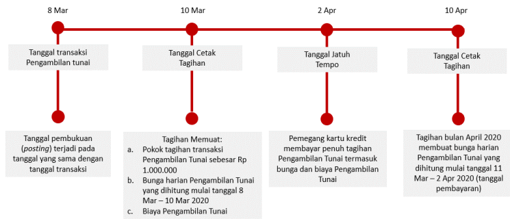
Ilustrasi Perhitungan Bunga Transaksi Tarik Tunai (Cash Advance)

Bunga untuk Pengambilan Tunai (Cash Advance) dibebankan dan dihitung sejak Tanggal Penarikan (Cash Advance) sampai dengan tanggal dilakukannya pembayaran penuh dari transaksi Pengambilan Tunai tersebut. Suku bunga yang berlaku untuk transaksi Pengambilan Tunai tercantum pada Lembar Penagihan. Biaya, denda, ataupun bunga yang belum dibayarkan tidak termasuk dalam komponen perhitungan bunga. Untuk perhitungan bunga secara lengkap dapat dilihat pada ilustrasi Perhitungan Bunga Kartu Kredit.