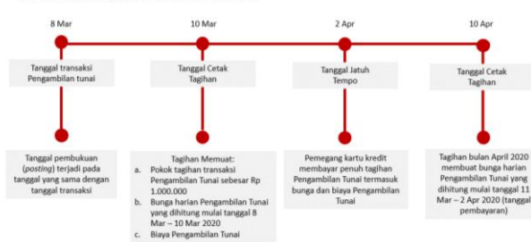
Ilustrasi Perhitungan Bunga Transaksi Tarik Tunai (Cash Advance)

Bunga untuk Pengambilan Tunai (Cash Advance) dibebankan dan dihitung sejak Tanggal Penarikan (Cash Advance) sampai dengan tanggal dilakukannya pembayaran penuh dari transaksi Pengambilan Tunai tersebut. Suku bunga yang berlaku untuk transaksi Pengambilan Tunai tercantum pada Lembar Penagihan. Biaya, denda, ataupun bunga yang belum dibayarkan tidak termasuk dalam komponen perhitungan bunga. Untuk perhitungan bunga secara lengkap dapat dilihat pada ilustrasi Perhitungan Bunga Kartu Kredit.