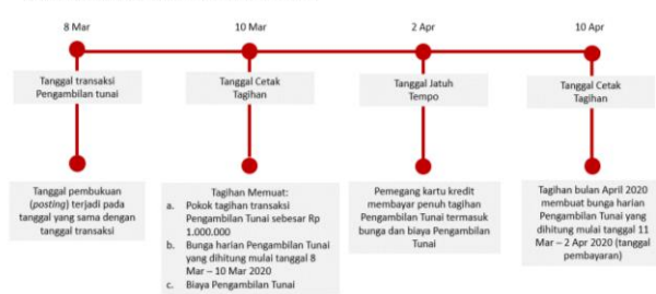
Ilustrasi Perhitungan Bunga Transaksi Tarik Tunai (Cash Advance)

Bunga untuk Pengambilan Tunai (Cash Advance) dibebankan dan dihitung sejak Tanggal Penarikan (Cash Advance) sampai dengan tanggal dilakukannya pembayaran penuh dari transaksi Pengambilan Tunai tersebut. Suku bunga yang berlaku untuk transaksi Pengambilan Tunai tercantum pada Lembar Penagihan. Biaya, denda, ataupun bunga yang belum dibayarkan tidak termasuk dalam komponen perhitungan bunga. Untuk perhitungan bunga secara lengkap dapat dilihat pada ilustrasi Perhitungan Bunga Kartu Kredit.